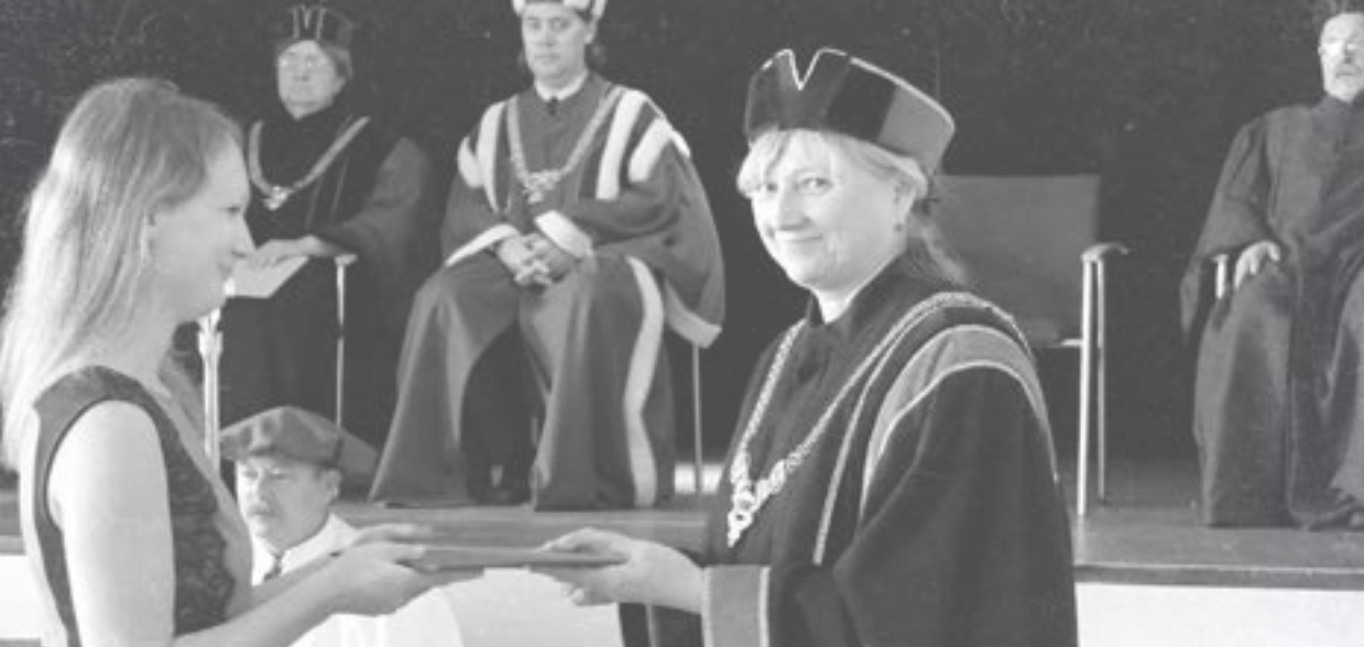
Děkanka fakulty na bakalářských promociích v roce 2019.