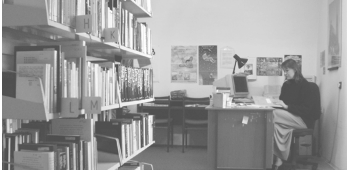
Bývalá knihovna na Masarykově ulici v roce 1993.

Milí a ochotní pracovníci knihovny zajišťují, kromě výpůjční služby, také meziknihovní výpůjční službu, mezinárodní meziknihovní výpůjční službu, informační a bibliografické služby či reprografické služby.