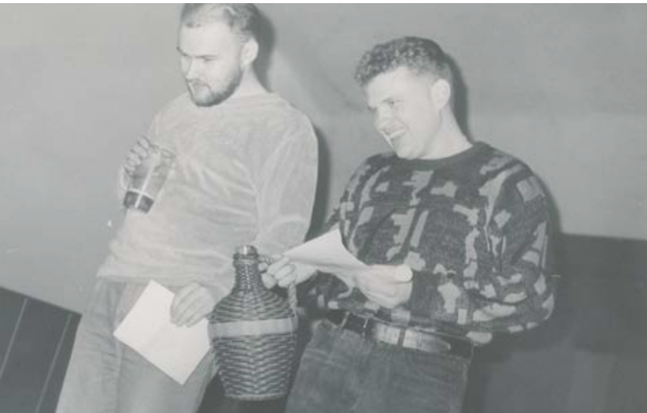
Studentská uvířací párty pro prváky na Palhanci v roce 1991.

O mimoškolní aktivity a akce u nás není nouze! Odborným mimoškolním aktivitám se věnují například Historický klub studentů Ústavu historických věd a Archeologický klub studentů Slezské univerzity. Tyto studentské kluby pořádají workshopy, tematické hospodské kvízy, či přednášky pro studenty i širokou veřejnost. Rozhodně nemůžeme opomenout kulturní oblast: studenti Kulturní dramaturgie v divadelní praxi se podílejí na organizaci multižánrového divadelního festivalu Na cestě, studenti Audiovizuální tvorby pak připravují se svými pedagogy mezinárodní festival studentských filmů Opavský páv. Jako student se můžeš rovněž zapojit do činnosti Komorního pěveckého sboru Slezské univerzity. Mnoho akcí organizuje také Studentská unie Slezské univerzity, která připravuje tradiční studentský Majáles, univerzitní ples nebo různé koncerty a párty.