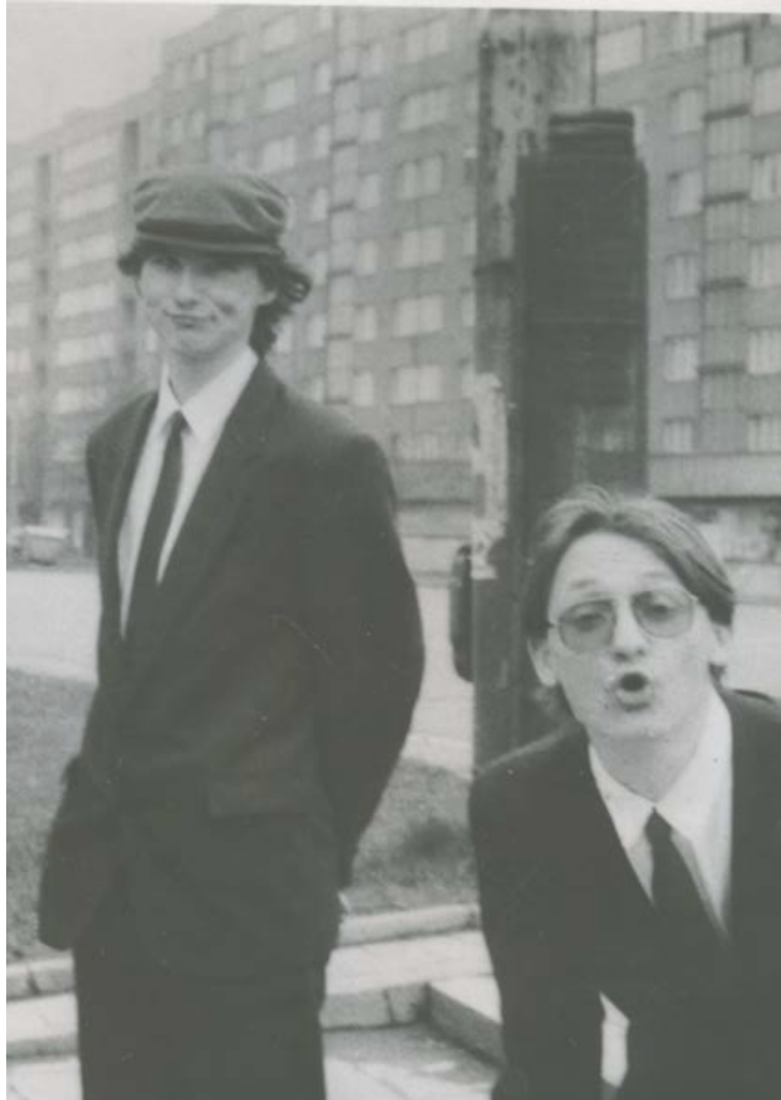
První studenti v roce 1990.

Slezská univerzita v Opavě nabízí stipendijní programy rektora – jejich nabídku naleznete na webových stránkách . O dalších stipendijních možnostech v rámci fakultních aktivit najdeš informace výše.