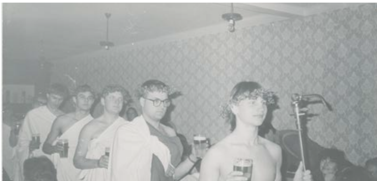
Studentská uvítací párty pro prváky na Palhanci v roce 1991.