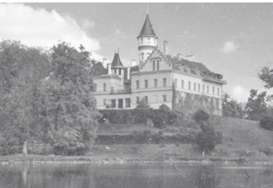
Nedaleký zámek Raduň.

Blízkost Jeseníků i Beskyd nabízí široké možnosti sportovního vyžití. Pro jasný a podzimní čas ti můžeme například doporučit Arboretum Nový Dvůr, malé skanzeny v Holasovicích a Bolaticích, aquapark a zámecký golfový areál v Kravařích. V blízkém okolí Opavy se také nachází mnoho památek, které stojí za navštívení. Můžeš zajet například na zámek v Raduňi, do Hradce nad Moravicí nebo na zříceninu hradu Vikštejn u Vítkova. Opavsko je rovněž známo hustou sítí bunkrů a opevnění vystavěných v letech 1935 až 1938. Do Ostravy tě může nalákat například známá Dolní oblast Vítkovice.