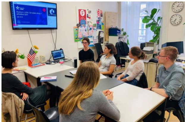
Semináře / Webináře