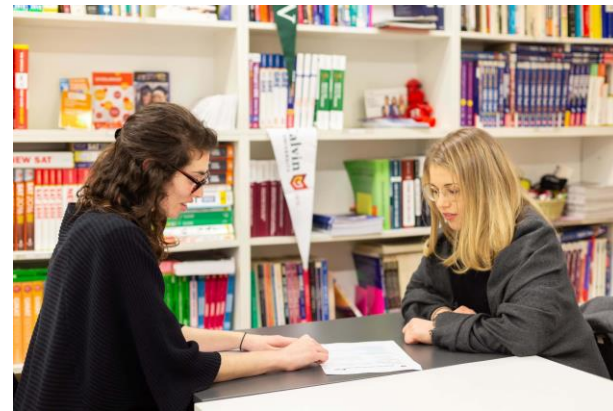
Konzultace: Osobně / Skype