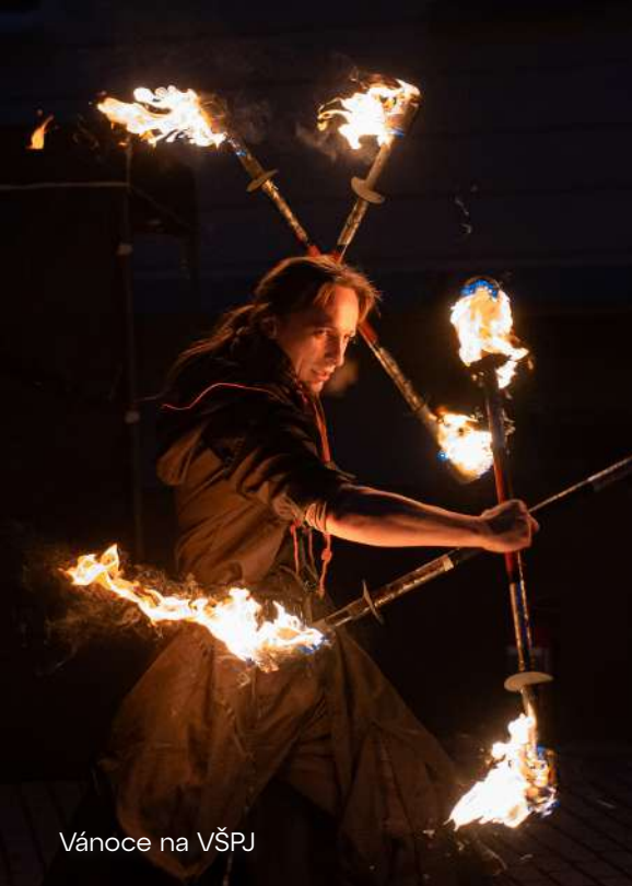
Vánoce na VŠPJ