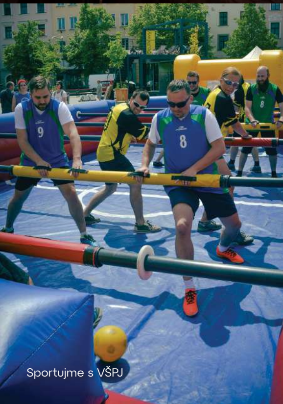
Sportujme s VŠPJ