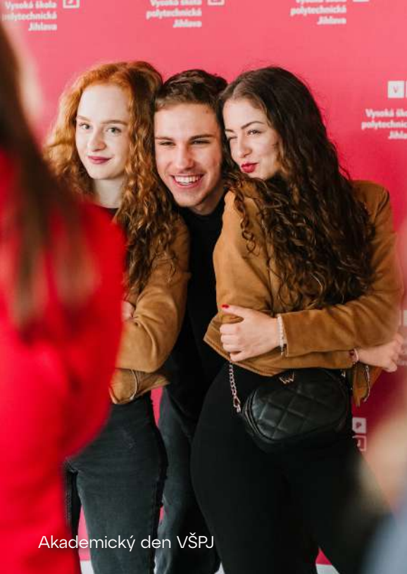
Akademický den VŠPJ