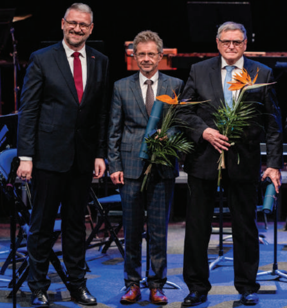
Slavnostní večer VŠPJ