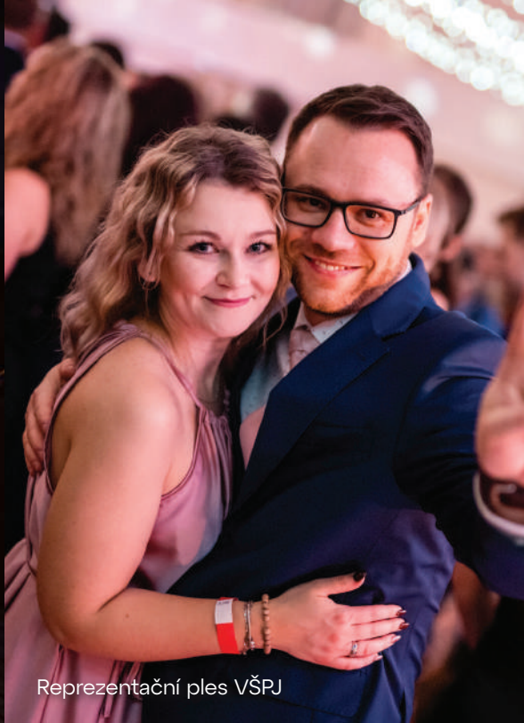
Reprezentační ples VŠPJ